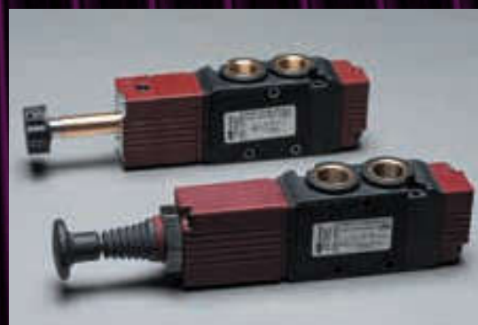
Válvulas 22 mm - 1/8"-1/4" polímero

Protección clase: IP65 (con conector). Caudal: 800 l/min (6 bar).